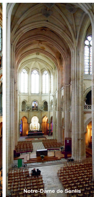
Notre-Dame de Senlis

Les 19, 20 et 21 mai 2026 Beauvais, Maison diocésaine 101 rue de la Madeleine